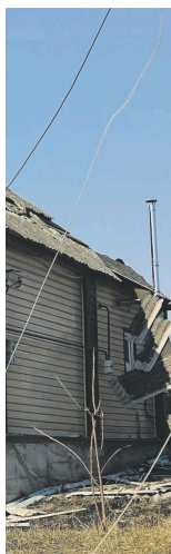
ministerie van Defensie verspreid.