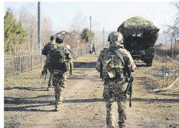
Russische militairen in Koersk, afgelopen vrijdag.

telefoon met Poetin overleggen om te zien of we een einde aan de oorlog kunnen maken. 'Misschien lukt het ons, misschien niet, maar ik denk dat we een goede kans hebben', zei hij maandag tegen verslaggevers aan boord van het presidentiële vliegtuig op weg naar Washington. 'We gaan praten over grondgebied, we zullen praten over kerncentrales', zei Trump. Volgens hem is er al veel besproken met Rusland en Oekraïne. 'We zijn al bezig te praten over de verdeling van bepaalde bezittingen'. De Oekraïners zien de gesprekken tussen Trump en Poetin ongetwijfeld met angst en beven tegemoet, temeer daar hun president, Volodymyr Zelensky, daarbij buitenspel staat. Tot nog toe heeft Trump alleen op Zelensky druk gezet om akkoord te gaan met een staak de wapens, terwijl Rusland bezig lijkt tijd te rekken door nu al negatieve concessies van Kyiv te eisen.